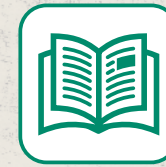
JOURNAUX / REVUES