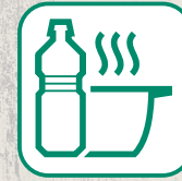
HUILES DE FRITURES