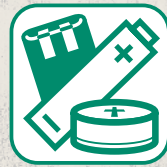
PILES ET ACCUMULATEURS