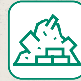
DÉBLAIS / GRAVATS