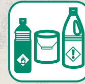
DÉCHETS DIFFUS SPECIFIQUE (DDS)